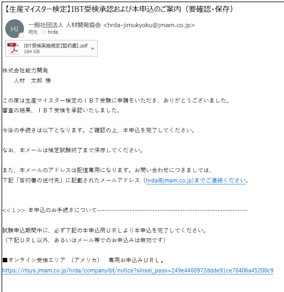
図3-1 仮申込承認メール（前半部分）